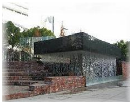
「慰霊と復興のモニュメント」

神戸市東遊園地には、震災の記憶、復興の歩みを後世に伝え、慰霊と市民への励まし、大規模災害からの復興「慰霊と復興のモニュメント」があり、毎年「阪神淡路大震災1.17のつどい」が開かれています。