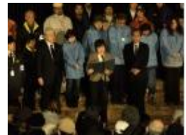
「阪神淡路大震災1.17のつどい」