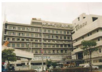
神戸市立西市民病院