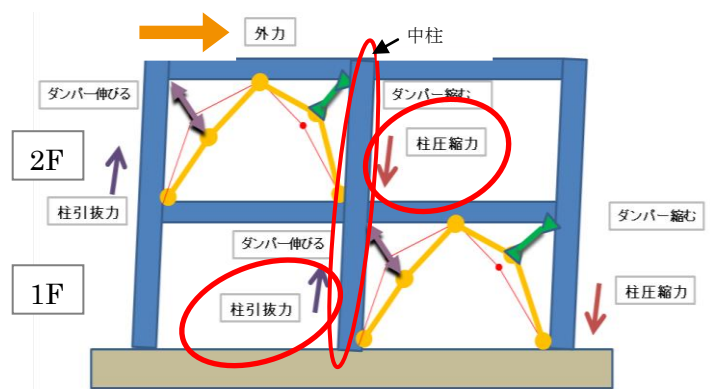
B 図：柱軸力のキャンセル概念図