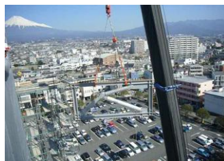
トグル枠吊り上げ