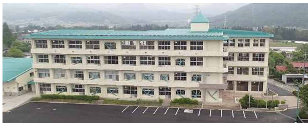
屋根とトグルの配色を揃えスッキリした印象