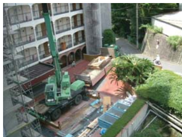
組立て済みトグル装置をトラックで搬入