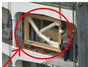
トグル装置を吊り込み・移動