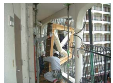
トグル装置取付け

一部廊下側手すりを外し、トグル装置を吊り込み、キャスターにのせ所定の位置まで廊下を移動させました。