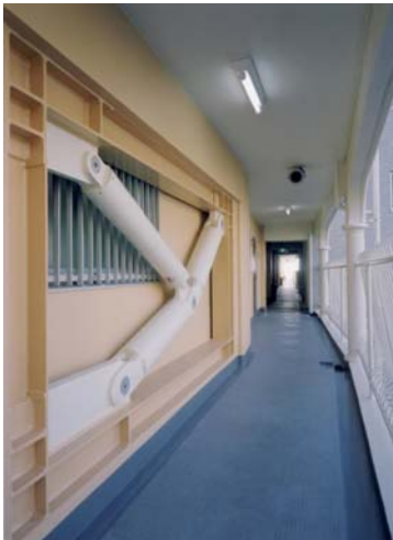
トグル装置設置住戸

一部廊下側手すりを外し、トグル装置を吊り込み、キャスターにのせ所定の位置まで廊下を移動させました。