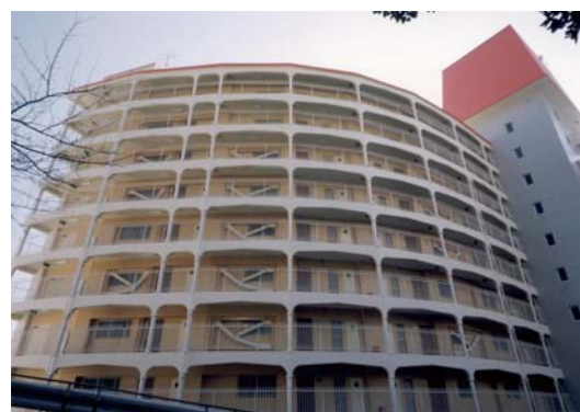
トグル装置設置後外観