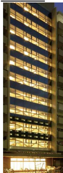
カーテンウォール 外観