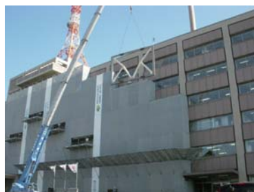
トグル装置の吊り上げ