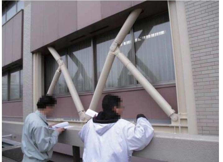
秋田県庁外観 クラックなし(23年3月14日撮影)