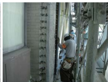
トグル装置の取付け