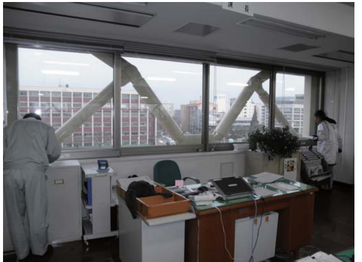
内部 机、備品の散乱なし(23年3月14日撮影)