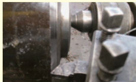
③パイプ材開先加工