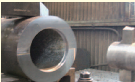
②パイプ材内径加工