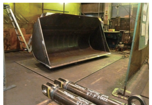
近くに大きなバケットがありました