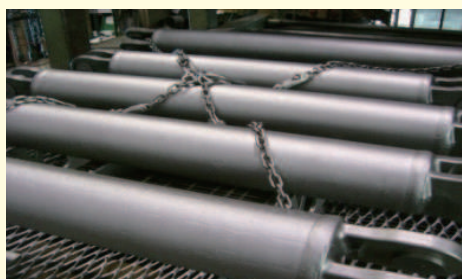
⑧ショットブラスト