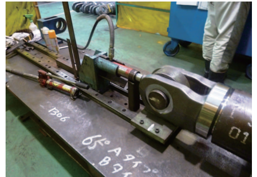
圧力を掛けてはめ込む