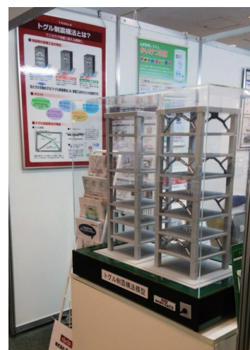
テクノトランスファー (2015.07)